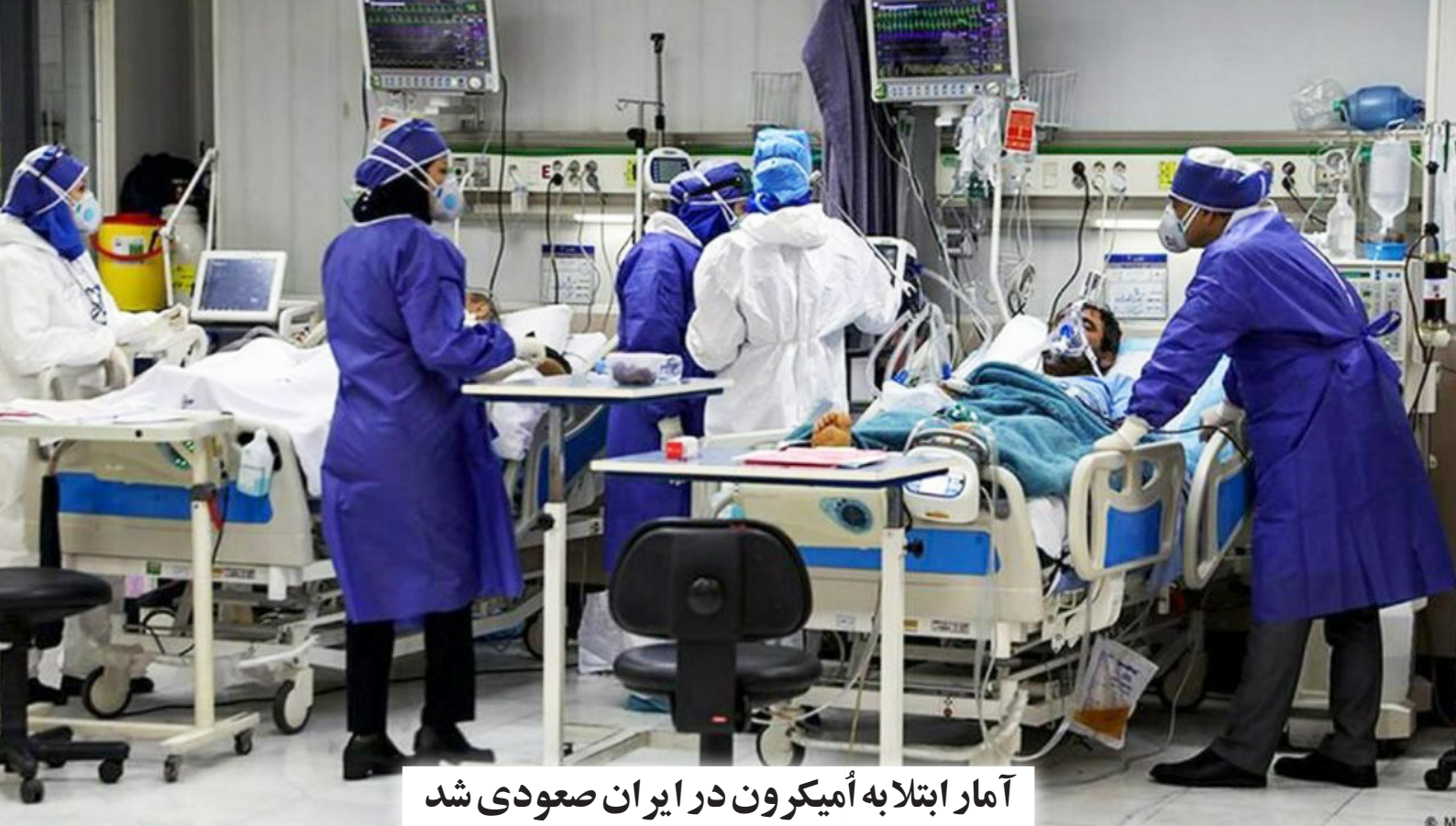
آمار ابتلا به امیکرون در ایران صعودی شد

سال ۱۷ شماره ۲۱۲۸ شنبه ۲۵ دی ۱۴۰۰ ۲۰۰۰ تومان www.sepidonline.ir