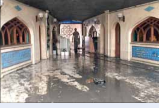
آب گرفتگی مجموعه ایرانی‌سرا در برج آزادی. ۲۳ غرقه صنایع دستی حاضر در این مجموعه با باران روز دوشنبه دچار خسارت فراوانی شده‌اند.