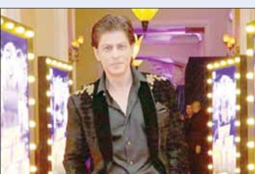
شاهرخان و همسرش با پایان گرفتن فیلمبرداری فیلم جدید ستاره بالیوود، بیست و پنجمین سالگرد ازدواجشان را جشن گرفتند.