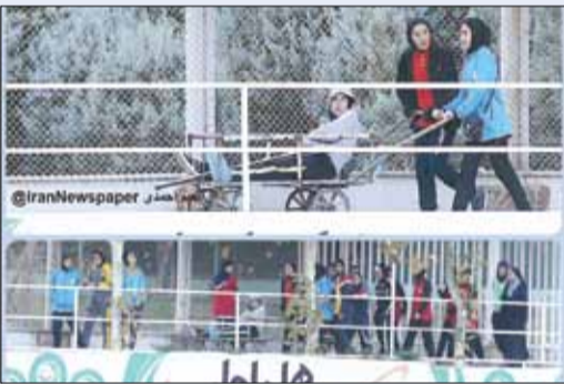
حمل مصدوم با چرخ دستی در تمرین تیم فوتبال بانوان در کمپ تیم ملی، ورزشگاه آزادی.