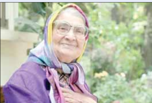
توران میرهادی عصر دیروز بر اثر سکته مغزی که او را به کما برده بود، از دنیا رفت.