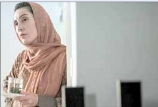
فیلم «آادت نمی کنیم» ساخته ابراهیم ابراهیمیان در بخش مسابقه بیست و یکمین جشنواره بین‌المللی «کراالا» به نمایش در می‌آید. این فیلم داستان زندگی زناشویی یک روانشناس است.