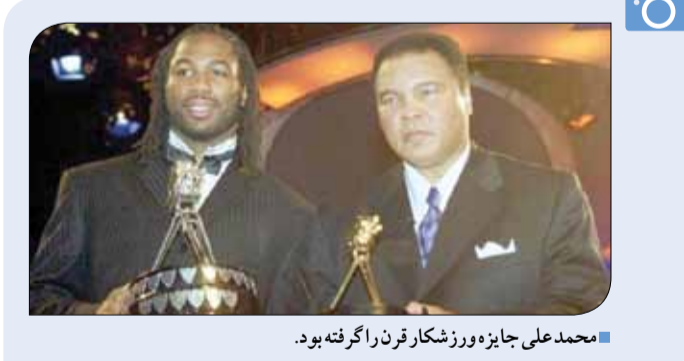
محمد علی جایزه ورزشکار قرن را گرفته بود.

مرگ محمد علی طرفداران او را تا ساعت و صدها شخصیت سیاسی و ورزشی را تحت تأثیر قرار داده است؛ کسانی که در دو روز گذشته پیام های متعددی را برای این اتفاق اعلام کرده اند. باراک اوباما، رئیس جمهوری آمریکا که بعد از مرگ کلی با همسر اولونی، تماس تلفنی داشت، در پیامی که داد او را با نلسون ماندلا و مار تین لوتر کینگ مقایسه کرد: «او مردی بود که برای ما جنگید. مبارزه او خارج از رینگ ممکن بود به قیمت قهرمانی و شهرت تمام شود، ممکن بود از چپ و راست دشمن بترشد و باعث شود به زندان بیفتد. محمد علی جهان را لرزاند و جهان برای همین جای بهتری است.» ■