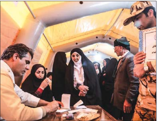
بهداری ارتش جمهوری اسلامی ایران در حاشیه سومین مرحله رزمایش دفاعی - امنیتی محمد رسول الله (ص)، بیمارستان صحرائی موقت در پارک جنگلی تریتم جام برپا کرد. در این بیمارستان که به شکل رایگان ارائه خدمت می‌کند، بیش از ۱۵۰۰ نفر پذیرش شدند.