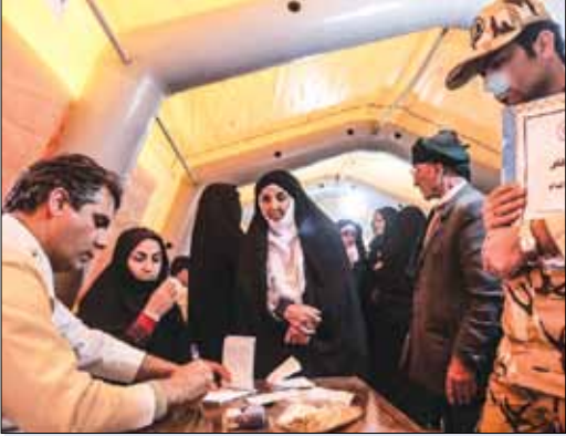
بهداری ارتش جمهوری اسلامی ایران در حاشیه سومین مرحله آزمایش دفاعی - امنیتی محمد رسول‌الله (ص)، بیمارستان صحرایی موقت در پارک جنگلی تربت‌جام برپا کرد. در این بیمارستان که به شکل رایگان ارائه خدمت می‌کند، بیش از ۱۵۰۰ نفر پذیرش شدند.