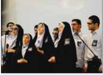
مراسم روز جهانی نابینایان (عصای سفید) صبح دیروز در تالار نژاد فلاح برگزار شد.