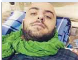
علی حیا، مجری تلویزیون با انتشار عکسی از خود خبر کشته شدن در منا او کشتن نشان داد.