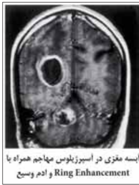
ابسه مغزی در اسپرژیلوزیس مهاجم همراه با Ring Enhancement و ادم وسیع